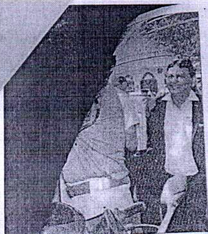
सोमवार को कश्मिर राउटर अस्थाना राहब ने एक बालक को गला पकड़ लिया। उसे कुछ गंभीर बात नही है उतराशय आ रही है ऐसे में घतन के धामे से फिती की जीवन की डोर कट नही जाये इसलिए नेक वेस्ट संपदी अभियान शुरू किया गया है। कमिश्नर राहब ने बालक वालकों को वेस्ट पहनाकर संपदी का संदेश दिया।